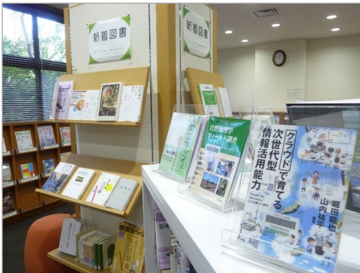
新着図書コーナー