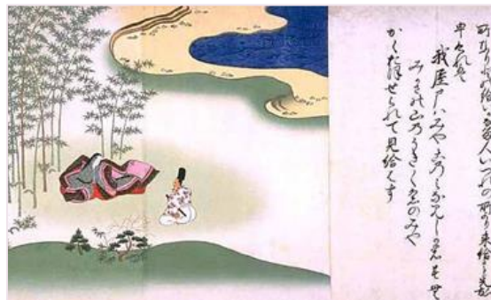
『春日権現靈驗記絵巻』より

(新) https://www.nara-wu.ac.jp/aic/gdb/mahoroba/y14/